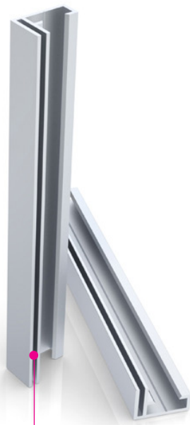
Beispiel Aluminiumleiste Smartframe

Die gängigen BABOR Thekenrückwände enthalten ein Smartframe-System (Aluminium-Leiste, in die eine am Textildruck aufgenähte Gummi-Kederleiste eingeschoben wird).