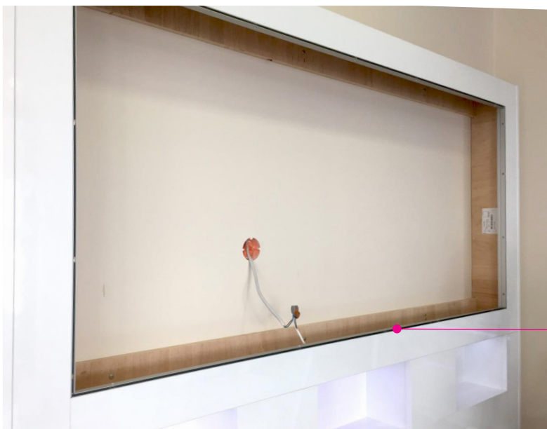
Beispiel BABOR Thekenrückwand mit Aluminium-Leiste